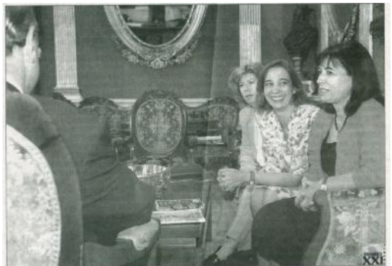
Representantes de la Asociación de Matronas, durante su entrevista con Olivares.

Hicimos un resumen de actividades realizadas por la Asociación en el año 1998 y 1999, como: Primer Encuentro, Boletín, Censo de Matronas, Federación de Asociaciones en tramites y Contactos con Asociaciones de Mujeres... y los proyectos para este año 2000, como el Curso de Educación Maternal en el Agua, Masaje del Bebé, Abordaje de la Sexualidad en la consulta