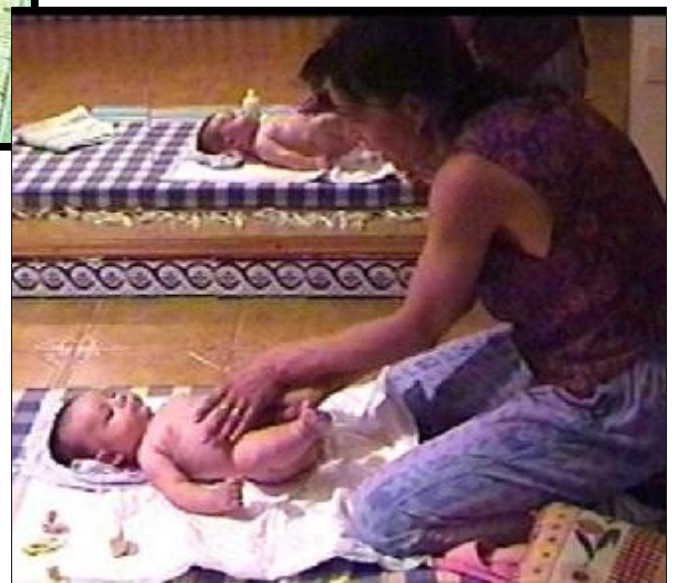
"Masaje del bebé" (Asociación Castellano Leonesa de Matronas).