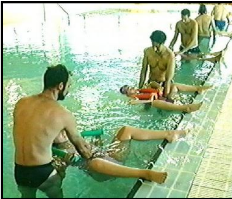
"Educación maternal en el agua" ( Vídeo de Laboratorios Carreras )