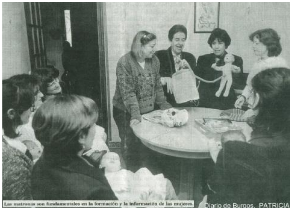
Las matronas son fundamentales en la formación y la información de las mujeres. Diario de Burgos. PATRICIA

Las mujeres conocen, cada vez más, su cuerpo en todo el proceso de su desarrollo, sexualidad, maternidad... y las matronas de Atención Primaria están contribuyendo activamente en esta educación para la salud de la mujer. Nuestro objetivo es dotar de mayor capacidad de decisión sobre los cuidados de Salud que desean recibir las mujeres